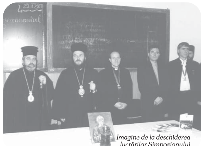
Imagine de la deschiderea lucrărilor Simpozionului