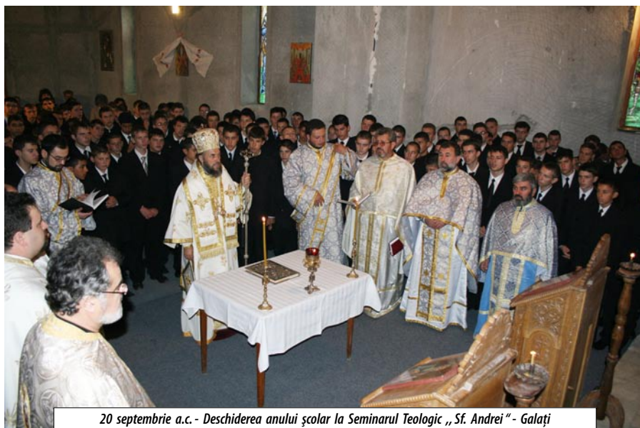
20 septembrie a.c. - Deschiderea anului școlar la Seminarul Teologic „Sf. Andrei” - Galați